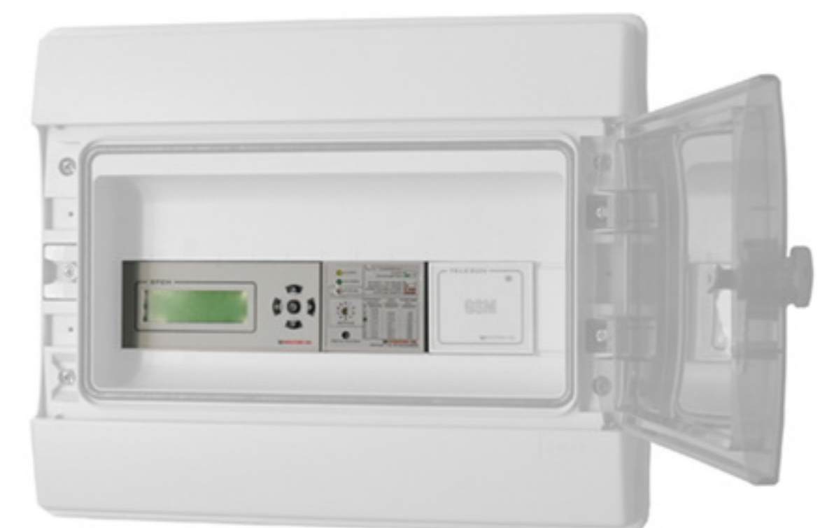
Esempio di installazione su quadro Example of installation on electric box